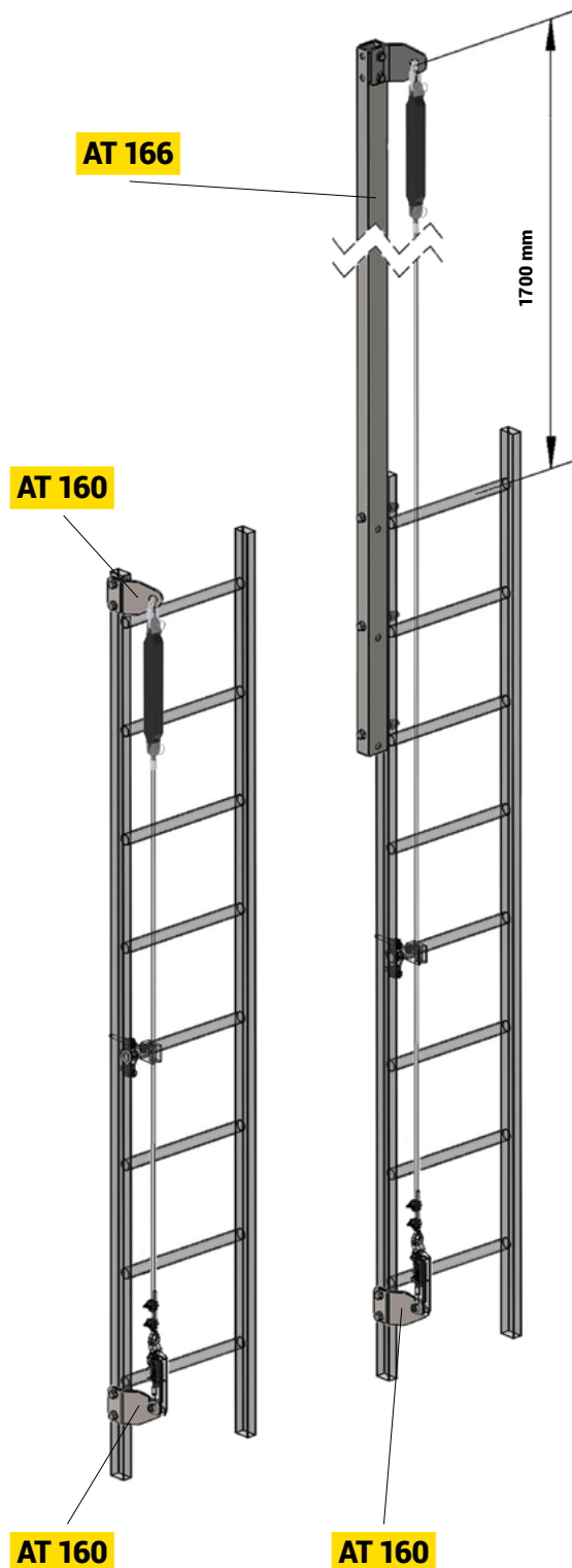
MONTAŻ DO POBOCZNICY DRABINY